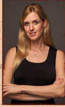
WILMA ELLES “Türkan”