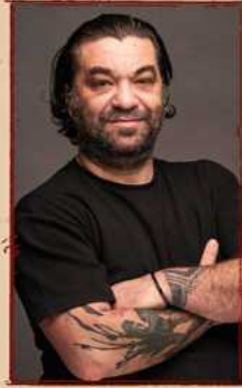
PARİ MAYIS “Kirkor”